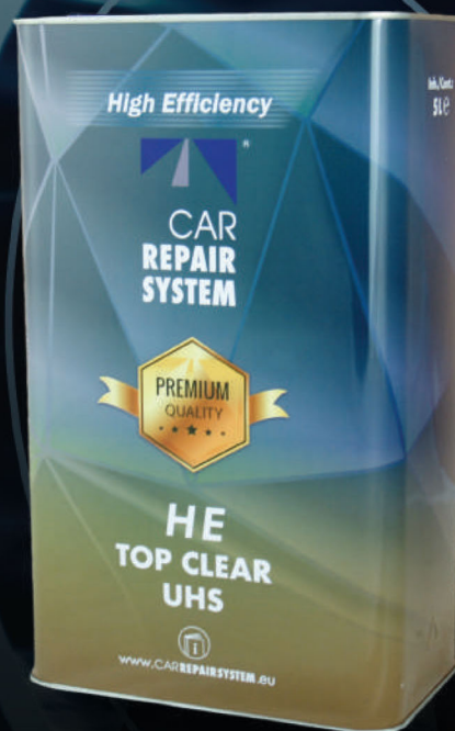
1510525 VERNIZ HE TOP CLEAR UHS 5L

Permite ser polido: em 90 min depois da sua aplicação a 60°C e de 2-3 horas depois da sua aplicação a 25°C sem necessidade de calor.